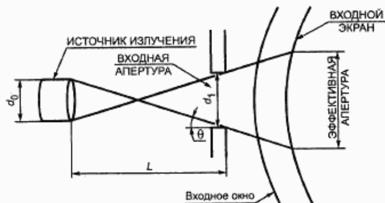
Рисунок 1 — Схема расположения ИСТОЧНИКА ИЗЛУЧЕНИЯ и ВХОДНОЙ АПЕРТУРЫ