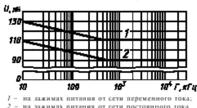
Предельные значения напряжения гармонических помех в полосе частот от 10 кГц до 30 МГц

1 - на зажимах питания от сети переменного тока; 2 - на зажимах питания от сети постоянного тока